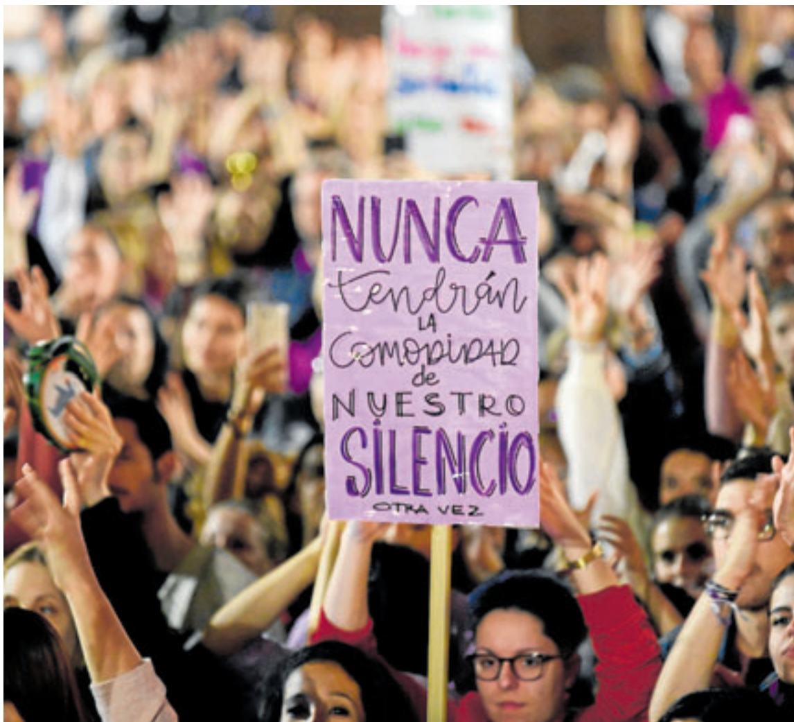
Foto de archivo de una manifestación del 25N en la capital grancanaria. c7

La Red Feminista de Gran Canaria subraya la importancia de