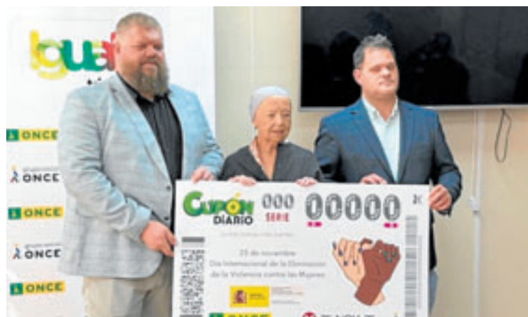
Presentación del cupón de la ONCE de este 25N. c7

«En los últimos años, hasta 2024, hemos incorporado anualmente a nuestra plantilla a más