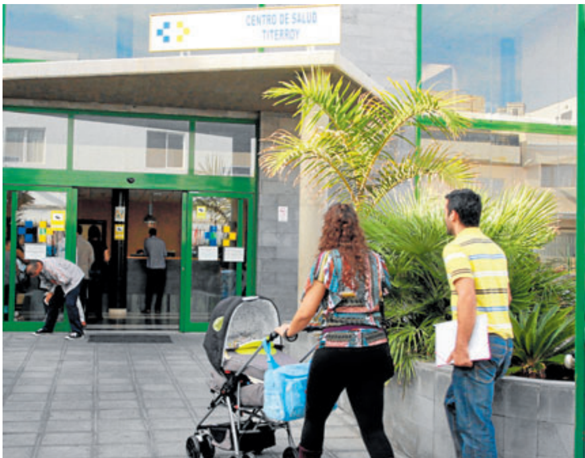
Foto de archivo de la entrada a un centro de salud. c7