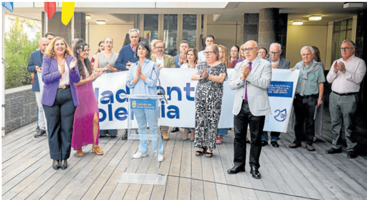
Aplausos tras la lectura del manifiesto contra la violencia de género. DAVID DELFOUR