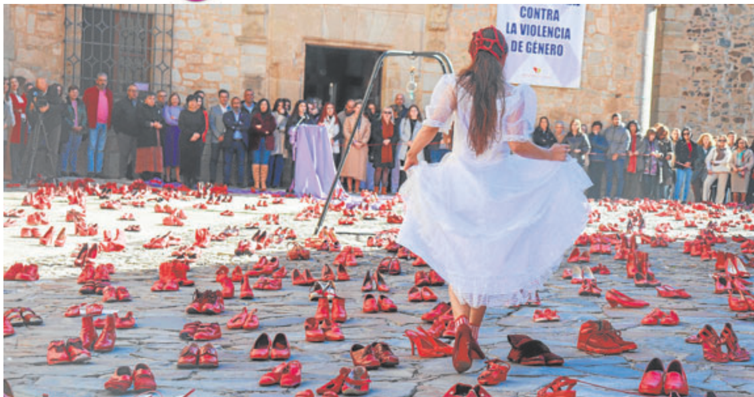
Las pisadas de la ausentes, en forma de zapatos rojos, alientan la lucha contra la violencia machista en una performance organizada en Cáceres.