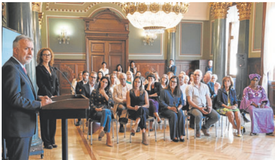
Un momento del acto de entrega de los reconocimientos Menina 2023.

Aún así, esta mujer superviviente de la violencia machista, hoy lo que quiere es «salir adelante», «crecer y no pensar en lo que me pasó», asegura.